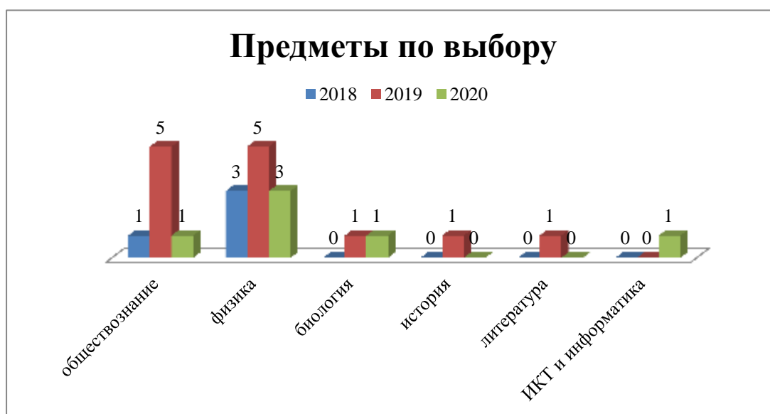
Выбор предметов для сдачи ЕГЭ за 2018, 2019, 2020 годы

В 2019/20 учебном году обучающиеся выбрали для сдачи ЕГЭ следующие предметы учебного плана: обществознание – 1 человек, физику – 3, информатику и ИКТ – 1, биологию – 1.