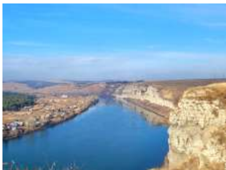
Белые скалы Вид на п. Усолье-7