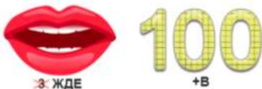
Ребус № 4